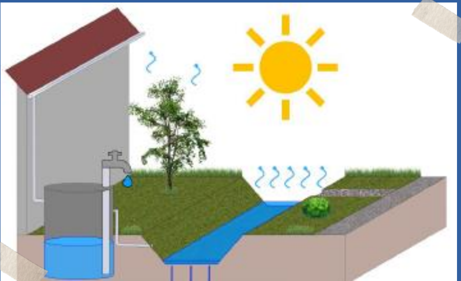
Versickerungsmulde mit (Retentions-)Zisterne

Es handelt sich hierbei um eine Kombination aus einer Versickerungsmulde und einer vorgeschalteten (Retentions-)Zisterne. Das Ziel dieser Anlagenkombination ist die Nutzung des Niederschlagsabflusses für Bewässerungszwecke bei gleichzeitiger konstanter Wasserbereitstellung bei längeren Trockenphasen (mit hohen Verdunstungsraten). Da es sich um ein kaskadiertes System handelt, sollte die Bemessung hierbei mit einer geeigneten Niederschlags-Abfluss-Simulationssoftware, unter Verwendung von Langzeitregendaten (Regenreihe von mindestens 10 Jahren) erfolgen.